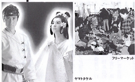
フリーマーケット

大安寺 除夜の鐘 合格祈願大祭 12/31(日) 大安寺(福井市田ノ谷町) 「千量敷」で知られる歴代福井藩主の菩提寺で心算に年越しを。参拝者による除夜の鐘つきの後、受験合格・健康・家内安全等の祈願が本堂で行われる。12月31日のみ拝観無料。 【問】大安寺 ☎0776-59-1014