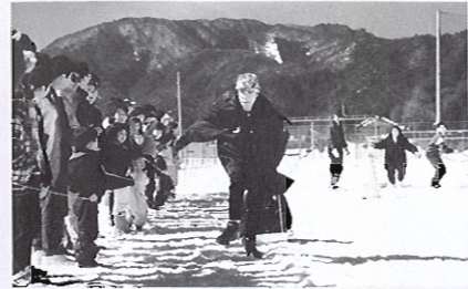
寒中ふれあい祭り

新雪国物語(みやまウインターフェスティバル) 2/10(土) 9:00～ 若鮎の里 あいいてえ周辺(美山町若鮎) 若鮎の里・あいいてえにて。大人と子供が一体となって雪に親しむのがテーマ。雪像コンテスト、雪積み大会、スノーモービル試乗会、カンジキレース、宝探し、どんとやきとイベント多数。先着順でキノコ汁も振るまわれる。料金無料。 【問】美山町企画観光課 ☎0779-74-1111