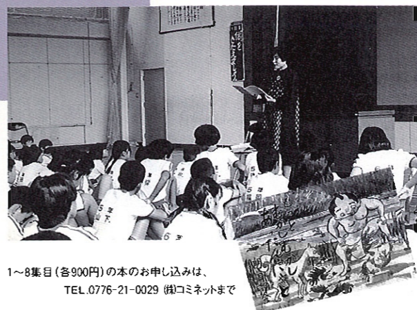
1~8集目(各900円)の本のお申し込みは、 TEL.0776-21-0029 (株)コミネットまで